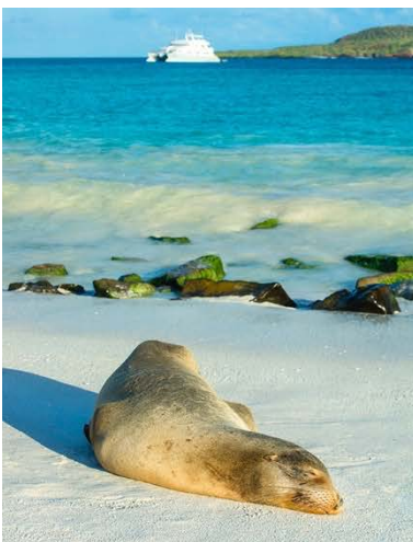
Traumstrand in der Tortuga Bay auf Santa Cruz

Über Nacht hat die Estrella ihre Fahrt in Richtung Westen fortgesetzt. Nach dem Frühstück erfolgt der letzte Landgang, wir setzen mit dem kleinen Beiboot auf die Insel Lobos über. Die Insel ist nach der großen Kolonie der Galápagos-Seelöwen benannt, die hier leben. Ebenso endemisch sind die Galápagos-Pelzrobben, die sich hier am Strand sonnen. Außerdem gibt eine Brutkolonie von Blaufußtölpeln, die jedes Jahr nach Lobos kommen, um ihre Küken aufzuziehen. Anschließend geht es nach San Cristóbal, wo unsere lange Kreuzfahrt endet und wir von der Crew und unserem Ranger Abschied nehmen müssen. Gegen 15.00 Uhr fahren wir mit einem Speedboot von San Cristobal nach Puerto Ayora auf Santa Cruz. Von hier aus kurze Fahrt in das nette Hotel, in dem wir die nächsten fünf Tage nächtigen werden. ÜN Hotel Fiesta (F/-/-). Hotelinfo: www.galapagoshotelfiesta.com