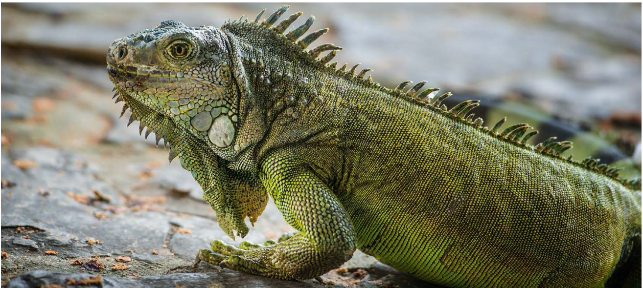
Weniger als 50 m vom Hotel in Guayaquil leben hunderte Iguanas in einem öffentlichen Park.

Nach dem Frühstück verlassen wir Puerto Ayora – auf der Fahrt zum Flughafen von Baltra überqueren wir noch einmal die Insel Santa Cruz. Dann endet unsere Zeit auf den Galápagos-Inseln und wir fliegen zurück auf das Festland nach Guayaquil. Transfer in das Hotel und der Rest des Nachmittags ist ohne Programm. Ein guter Tipp für die freie Zeit ist der, nur wenige Schritte vom Hotel entfernte, Iguanapark. Eine bessere Gelegenheit, die steinzeitlich-anmutenden Iguana-Echsen zu fotografieren gibt es kaum. ÜN Hotel Unipark (F/-/-).