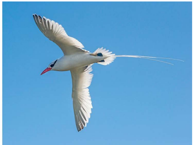
Fregattvogel und ein Rotschnabel-Tropikvogel - die Galapagos sind ein wahres Vogelparadies.