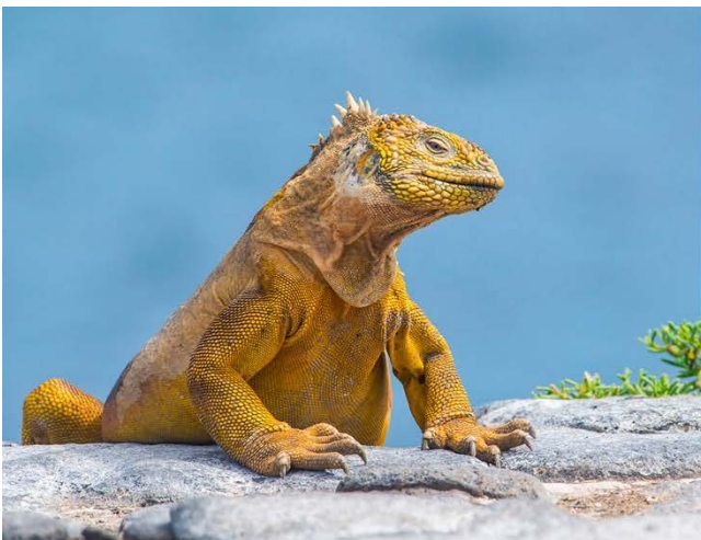
Wie aus einer anderen Zeit: Drusenkopf (Galapagos-Landleguan) und die endemische Meerechse.

Es gelten unsere Allgemeinen Reisebedingungen in der letztgültigen Fassung (deutschsprachige Version, Stand 20. 01. 2019), die Sie zusammen mit der Buchungsbestätigung in ausgedruckter Form erhalten. Alle Angaben, Preise und Leistungen entsprechen dem Stand der Drucklegung. Wechselkurs-, Tarif- und Programmänderungen sowie etwaige Druckfehler sind vorbehalten.