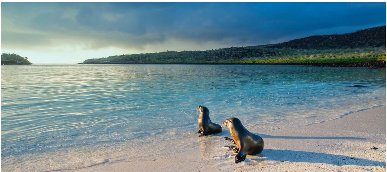
Galapagos-Exklusiv - durch das kleine Schiff können wir oft in völlig einsamen Buchten anlegen.