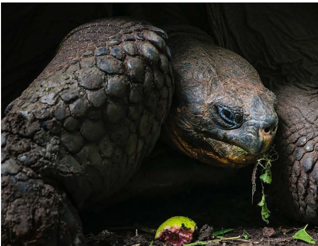
Riesenschildkröte auf Santa Cruz - und eine der typischen Anlandungen mit dem Beiboot.

Die Reiseroute während der Galápagos-Kreuzfahrt kann sich ebenfalls von der geschilderten Route unterscheiden – abhängig von Meeres- und Windverhältnissen sowie den aktuellen Verhältnissen beim Anlanden kann der Captain die Route abändern.