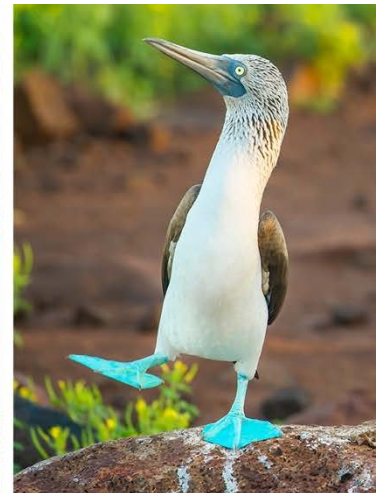
Der berühmte „Pinnacle Rock“ auf Bartolomé - und ein tanzender „Blue Footed Booby“, ein Blaufußstölpel.