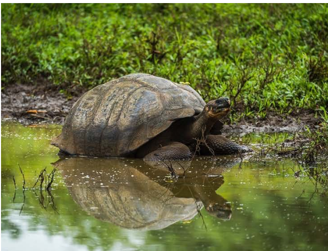
In den Lagunen von Galapagos.

Neben der reisemedizinischen Beratung empfehlen wir auch eine zahnärztliche und eine allgemeinmedizinische Vorsorgeuntersuchung.