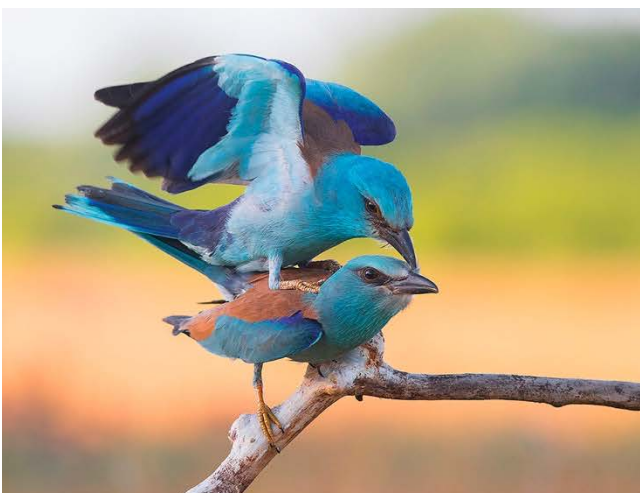
Blauracken und Bienenfresser.

Unser Partner hat in den letzten Jahren in und rund um das Naturschutzgebiet eine ganze Reihe von hochwertigen Fotohides errichtet – viele sind direkt am Wasser und bieten sehr niedrige Fotostandpunkte an, einige Hides sind in Waldgebieten, wieder andere in der sandigen Steppe direkt an der Grenze zu Ungarn. Immer noch ist die Region ein Geheimtipp für engagierte Vogel- und Wildlife-Fotograf/innen, dabei steht das Gebiet der bekannten und benachbarten Region von Kiskunság in Ungarn um nichts nach – im Gegenteil, es gibt rund um Subotica mehr Arten an Vögeln und Säugetieren, als es jenseits der Grenze der Fall ist. Alles in allem ist dieser nördlichste Teil der Vojvodina ein perfektes Zielgebiet für Vogel- und Wildlife-Fotograf/innen!