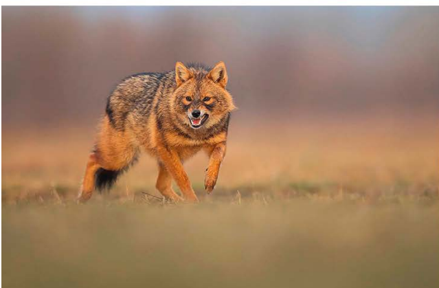
Beste Fotomöglichkeiten aus den tollen Fotohides bei Subotica/Serbien.