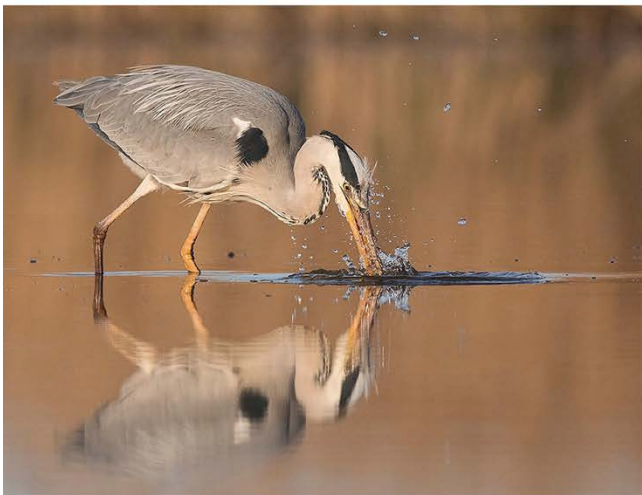
Spezielle Hides, um den perfekten Augenblick festzuhalten.