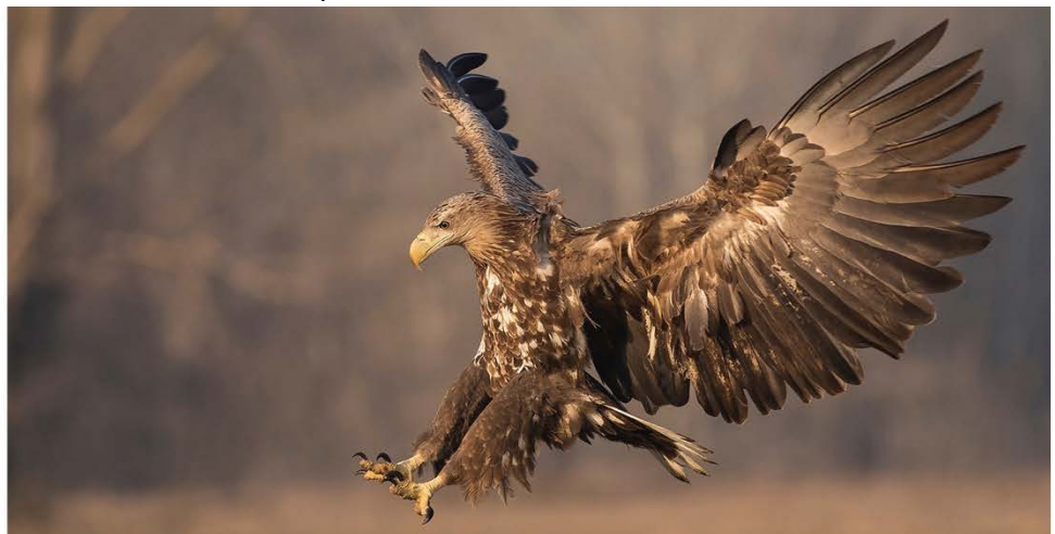
Fotografieren aus speziellen Hides für Wasser- und für Raubvögel.