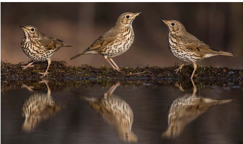
Die sorgfältig angelegten Wasser-Hides sorgen für perfekte Spiegelungen.